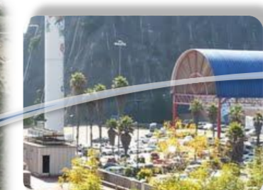
Imágenes del terreno