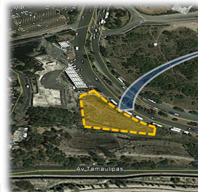
Ubicación del terreno