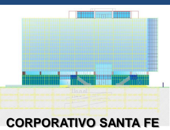
CORPORATIVO SANTA FE